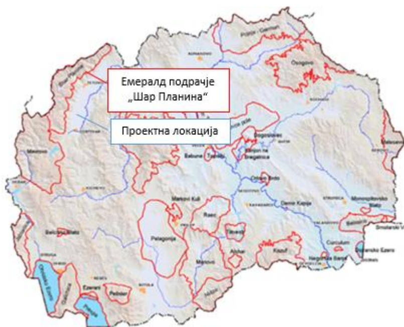
Слика 4 Емералд подрачје „Шар Планина“

Значајно Растително Подрачје (ЗРП) „Шар Планина“ – Подрачјето Шар Планина се простира во северозападниот дел од Република Северна Македонија. Припаѓа на територијата на општините Јегнуовце, Теарце, Тетово, Боговиње, Врапчиште и Гостивар. Покрива голема површина со планини и високо планински пасишта. Најзастапени се шумите од бука и смрека. Во однос на шумски хабитати, најпознат дел од Шар Планина е масифот Церипашина, како и Плат со Долна Лешница.