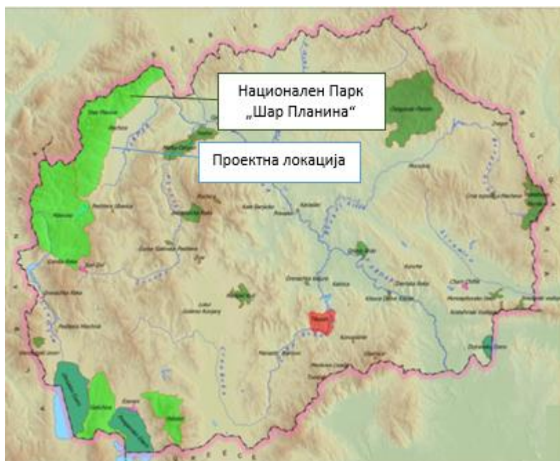
Слика 3 Заштитено подрачје Национален Парк „Шар Планина“ (категорија II)