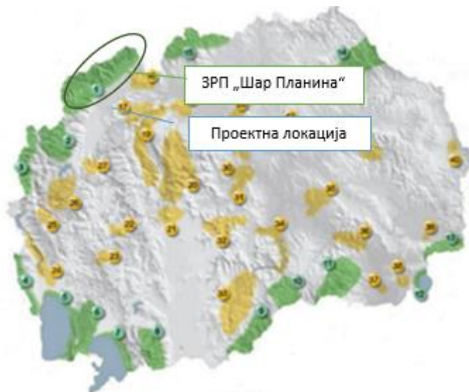
Слика 5 Значајно Растително Подрачје (ЗРП) „Шар Планина“

Значаен Оринтолошки Локалитет (ЗОЛ) „Шар Планина“ – Од прегледот на застапеноста на птиците по живеалишта, според нивниот статус на гнездење, како и критериумите за валоризација, планинските и високопланинските отворени терени и смрека и букова шума се од поголемо значење за заштита (примарно според Директива за птици, како и Конвенциите од Берн и Бон).