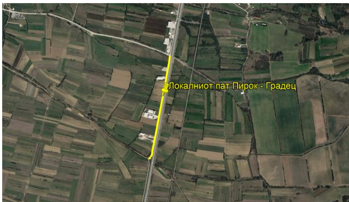
Слика 1 Локација на локалниот пат од Пирок до Градец покрај регионалниот пат М4 во Општина Боговиње

Обезбедувањето на навремени информации за компаниите и складиштето на страната на патот пред почетокот на реконструктивните работи е од суштинско значење за да се минимизира влијанието на обичниот транспорт на стоки и да се организира нивниот секојдневен синџир на снабдување.