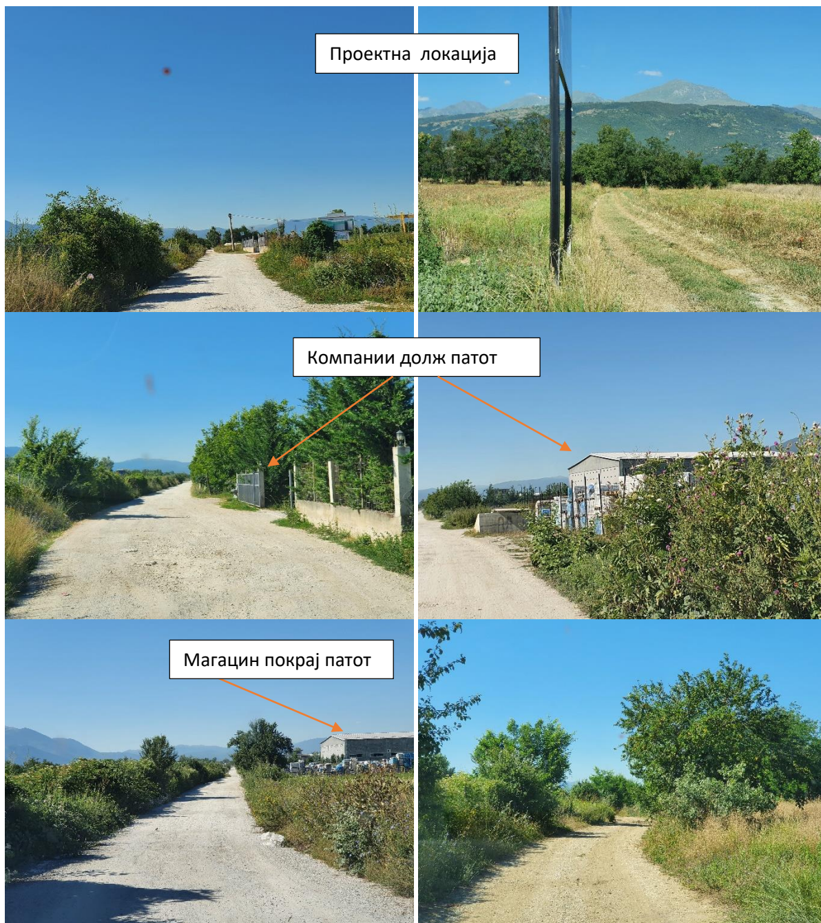
Слика 2 Сегашна ситуација на локалниот пат во Општина Боговиње

Проектот припаѓа во поглавје XI – Инфраструктурни проекти, точка 1 – Реконструкција на локални патишта и улици, за кои е потребно да се изработи Елаборат за заштита на животната средина. Елаборатот за заштита на животната средина е изработен во Февруари 2022 година од страна на „Про Инженеринг - Тетово“.