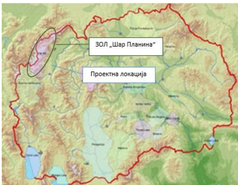
Слика 6 Значаен Оринтолошки Локалитет (ЗОЛ) „Шар Планина“

Значаен Оринтолошки Локалитет (ЗОЛ) „Шар Планина“ – Од прегледот на застапеноста на птиците по живеалишта, според нивниот статус на гнездење, како и критериумите за валоризација, планинските и високопланинските отворени терени и смрека и букова шума се од поголемо значење за заштита (примарно според Директива за птици, како и Конвенциите од Берн и Бон).