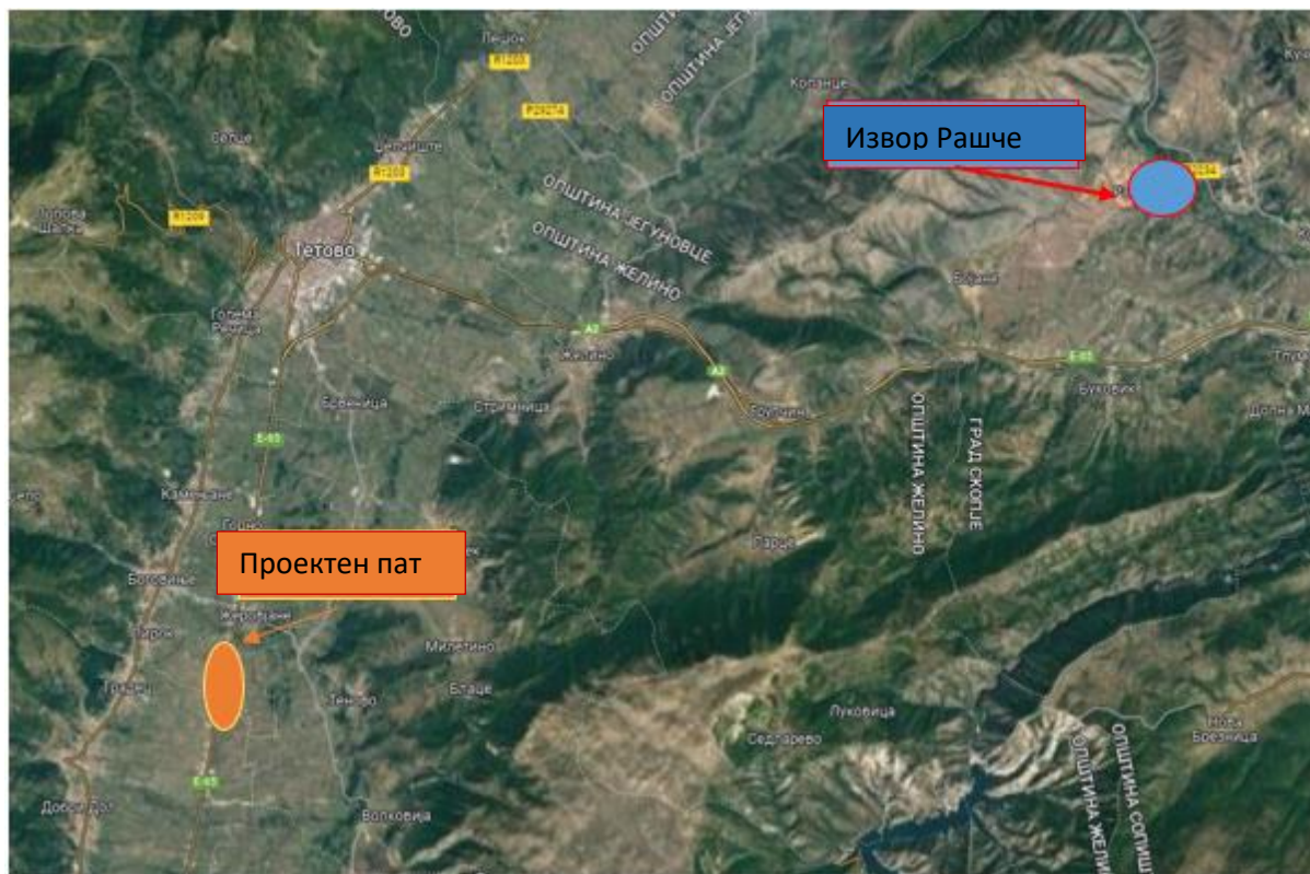
Слика 7 Локација на проектот локален пат во општина Боговиње во однос на извор Рашче (се наоѓа во општина Сарај, град Скопје)

Согласно Одлуката за определување на границите на заштитните зони на изворот Рашче и определување мерки за заштита (Сл. весник бр. 3/21), проектното подрачје е дел од 3та заштитна зона на изворот Рашче.